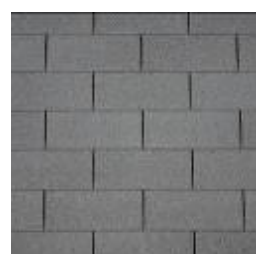
31 - Slate