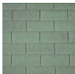
03 - Green