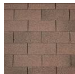
07 - Brown