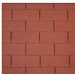
10 - Red